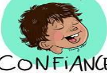
Illustration de Fanny Vella.

Lien : https://i.facebook.com/l.php?u=https%3A%2F%2Fwww.instagram.com%2Ffannyvella%2F&h=AT2_SgHuHTAaCFVXIIkhsRkH7DB80uYIS6bvh39CotrFICIFONLZeUQIsTiv2iinGHENKUmg80nNBZiSZQ1nMyTmuWCf6P61zcRP9DVwbkCuWBwzaIMQqJAup1bvroAATfwOCudCu6s1UxjYRx-43njedphKi8348pTCg